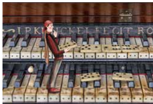
Illustraties: Marijke Mosterman op basis van foto's van Dick Sanderman

kinderen een orgel. Voor de derde en afsluitende les zijn de verwerkingsopdrachten gebundeld in een werkblad met een stadsplattegrond. Via een klassikaal te beluisteren hoorspel lopen de kinderen een virtuele route door de stad en vinden daar de sleutel die leidt tot de oplossing van het laatste raadsel. Het project kan in de klas worden uitgevoerd, de eerste en de derde les door de eigen leerkracht of een muzikleerkracht. Voor de tweede les zoekt Orgelkids een groepje vaste organisten die op aanvraag het project in hun regio kunnen verzorgen. Natuurlijk wordt er muziek gemaakt: enkele nieuwe composities die zijn geschreven voor het Doe-orgel krijgen een plaats in het project.