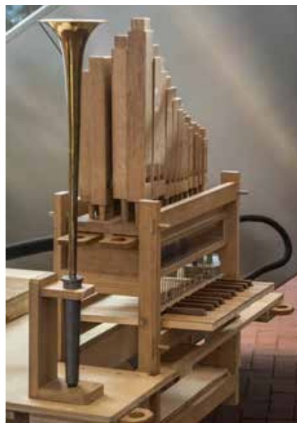
Het Doe-orgel van de orgelfiets.