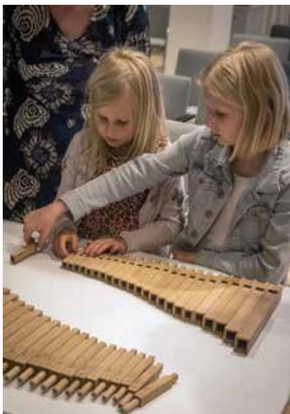
De jongste deelnemers aan de inspiratiedag.