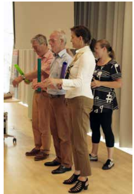
'Boomwhackers' in actie.